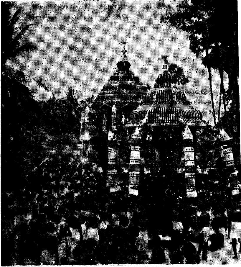
அருள்மிகு இணுவைச் சிவகாமியம்மை திருத்தேர்த் திருநாள்